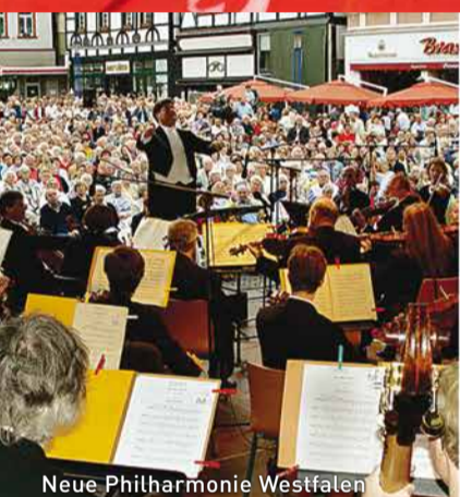
Neue Philharmonie Westfalen