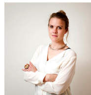
Terry Reintke, Bündnis 90/Die Grünen