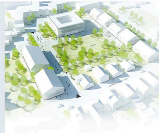
Erste grobe Skizze zum geplanten Campus Bildung in Leer. (Ahrens Grabenhorst - Architekten)

Durch den Abend führt Ludger Abeln - ehemaliger Fernsehmoderator