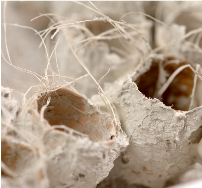
„Bugg eggs“ (Detail) handgeschöpftes Papier aus Maulbeerbaumrinde, Papiermaché und Sisal