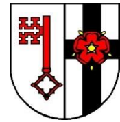
Kreis Soest Die Landrätin

Bundeskanzleramt Bundeskanzlerin Angela Merkel Willy-Brandt-Straße 1 10557 Berlin