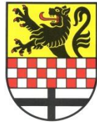
Märkischer Kreis Der Landrat