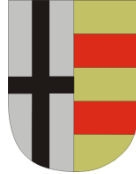
Kreis Olpe Der Landrat