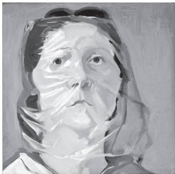
Maria Lassnig, Selbstportrait unter Plastik 1972

Die Kunsthalle Bielefeld präsentiert Werke von Künstlerinnen seit Ende des 19. Jahrhunderts bis in die 1930er-Jahre und führt in ausgewählten Positionen bis zur Malerei der Gegenwart.