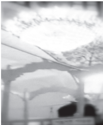
© Suria Kassimi © VG Bildkunst 2014

Jede Präsentation der transparenten Fotoarbeiten wird zum Anlass einer Verschmelzung mit dem Hintergrund des jeweilig neuen Ausstellungsraumes/Ortes und in weiteren Fotografien festgehalten. Die Maschinenhalle der Zeche Scherlebeck ist damit ein weiterer Ort, der zur Entwicklung dieses Kunstwerkes beiträgt.