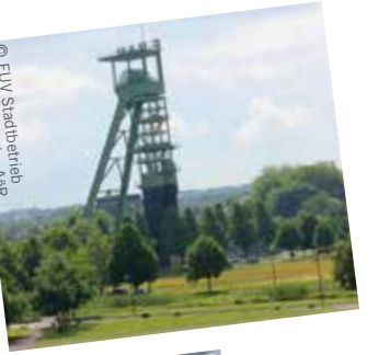
© EVV Stadtbetrieb Castrop-Rauxel - AöR