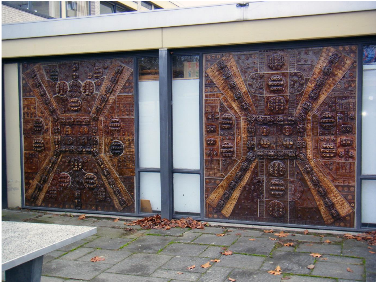
Wandreliefs von Rudolf Mauke an der ehemaligen Erich-Kästner Grundschule

Maukes Arbeit hatte schon in der Vergangenheit viel Zuspruch aus der Verwaltung erhalten. Überhaupt war er im Jahr 1964 erst auf Anfrage des damaligen Oberbürgermeisters Uwe-Jens Nissen nach Wolfsburg gelockt worden. Seine daraufhin geschaffenen Werke im Wolfsburger Klinikum, ein 5,5 Meter mal 3 Meter großes Wandrelief, oder eine sich im Schloss Wolfsburg aufgestellte Vase, wirken im Vergleich mit seinen Arbeiten, die er für die Weltausstellungen in Brüssel (1959) und den Berlin-Pavillon in New York (1964) großformatig auf 32 Quadratmetern geschaffen hatte, zwar verhältnismäßig klein, doch sind sie gerade vor diesem Hintergrund wahre Schätze im Wolfsburger Stadtbild.