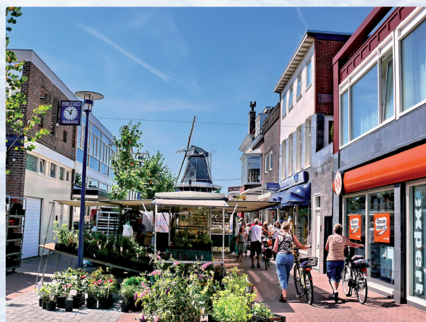
Der Markt in Delfzijl mit der Mühle „Adam“ im Hintergrund

Zurück in Delfzijl angekommen können Sie auf dem Molenplein, dem Mühlenplatz, die große Mühle „Adam“ und die Kirche „Nederlands Hervormende Kerk“ anschauen.