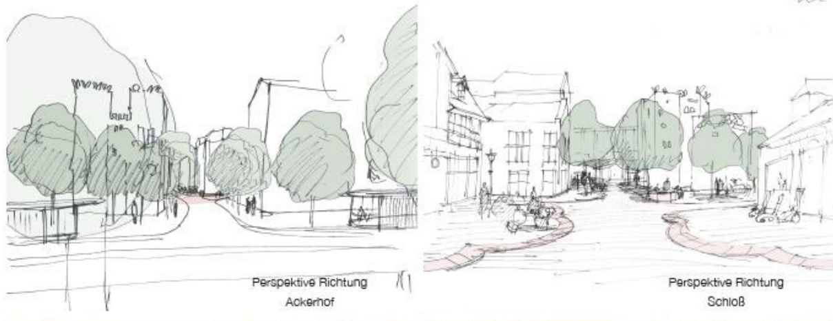
- Erste Ideenskizzen Ackerhof (Welpvon Klützing Braunschweig)

Träger: Stadtplanungs-, Verkehrs-, Tiefbau- und Baudezernat