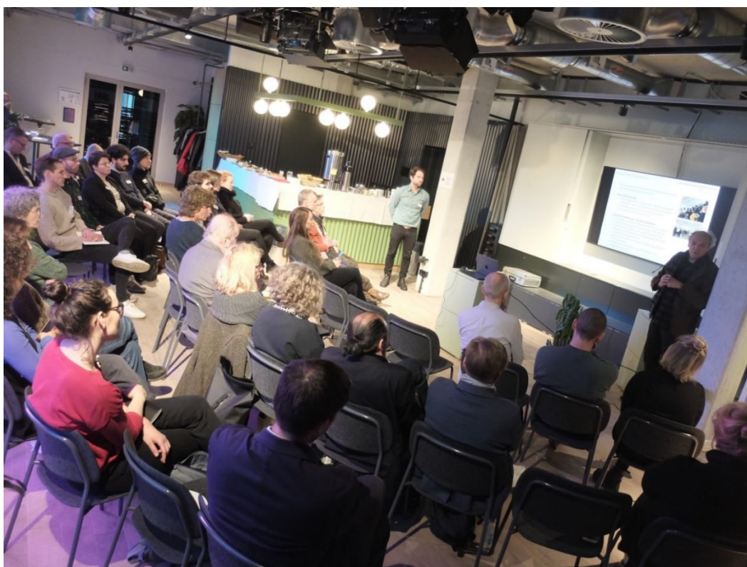
Workshop mit Kulturschaffenden und Vertreter:innen der Immobilienbranche am 17.01.2023, 14.00 bis 18.00 Uhr im 381 I

Träger: Kultur- und Wissenschaftsdezernat