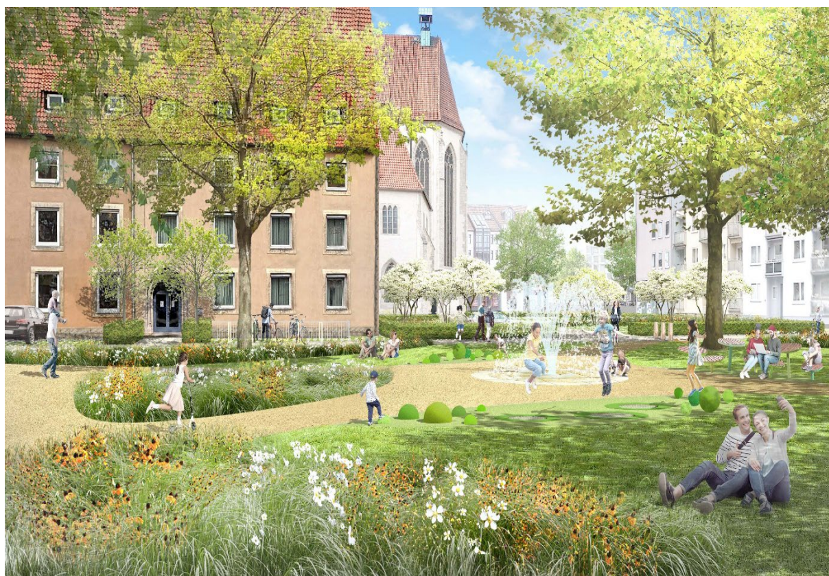
Abbildung 1: Büro Levin Monsigny, Berlin

Träger: Umwelt-, Stadtgrün-, Sport- und Hochbaudezernat