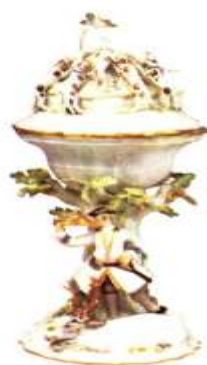
Meißener Jagdpokal für den Kurfürsten Clemens August von Köln, 1741