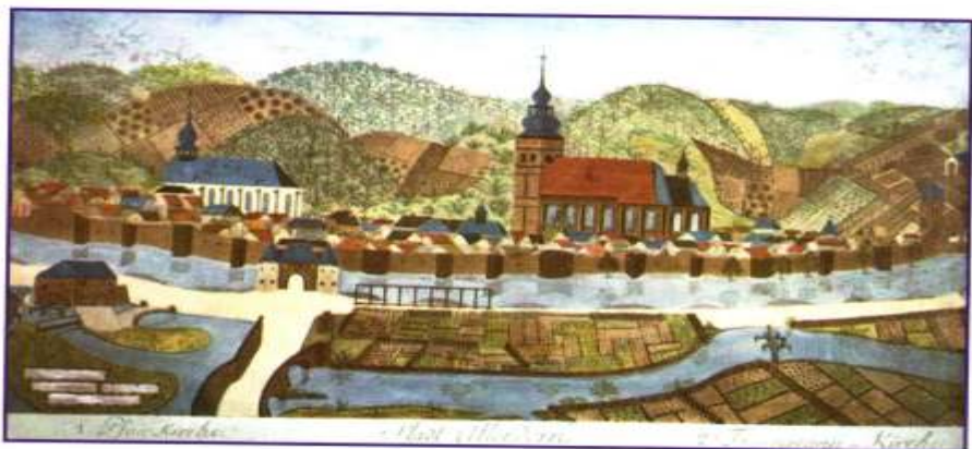
Ansicht der Stadt Attendorn, um 1800

und Engern erhob Kaiser Friedrich Barbarossa den Kölner Erzbischof Philipp von Heinsberg. Zur Sicherung ihrer Macht errichteten die Erzbischöfe zahlreiche Burgen und erhoben zur Stärkung ihrer wirtschaftlichen Bedeutung zahlreiche Orte zu befestigten Städten.