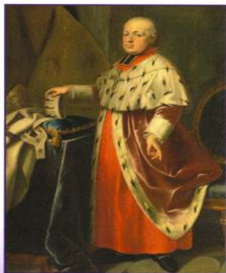
Maximilian Franz als Erzbischof von Köln

DIE BESTREBUNGEN von Erzbischof Maximilian Franz, im Sinne der Aufklärung verschiedene Reformen durchzusetzen, scheiterten meist am Widerstand der Landstände.