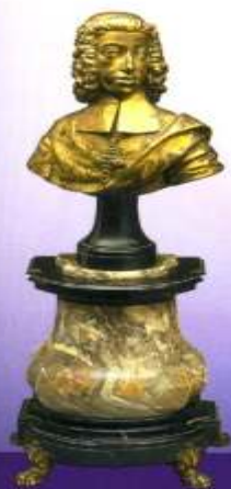
Büste des Kurfürsten Clemens August von Bayern, um 1725/30