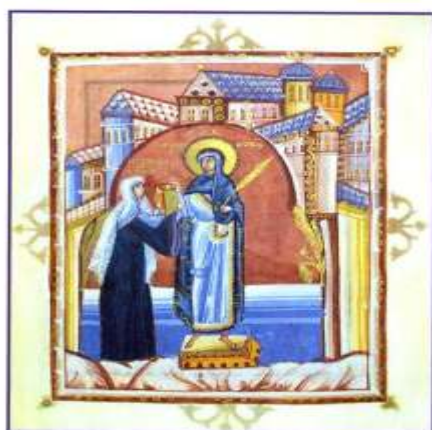
Hitda-Codex für das adelige Damenstift St. Walburga Meschede, um 1000.