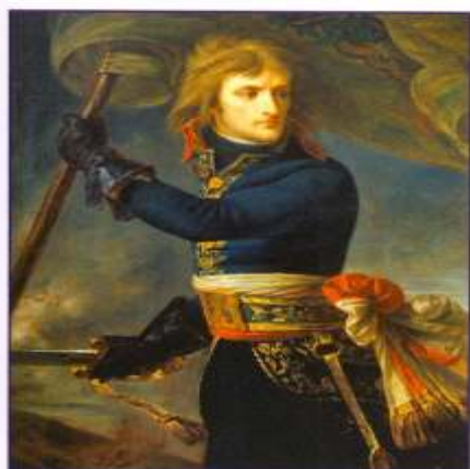
Antoine Jean Gros: General Bonaparte auf der Brücke von Arcole am 17. November 1796

PRÄSENTIERT WERDEN zahlreiche wertvolle Gemälde, Kunstgegenstände und Archivalien wie u.a.: