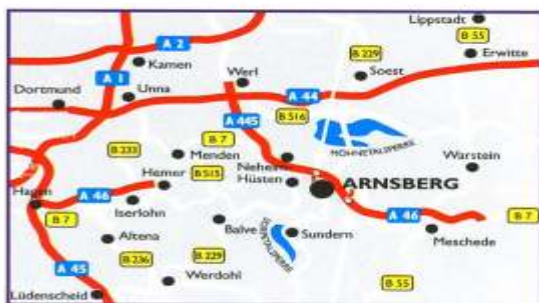
Abfahrt 65 Arnsberg-Altstadt