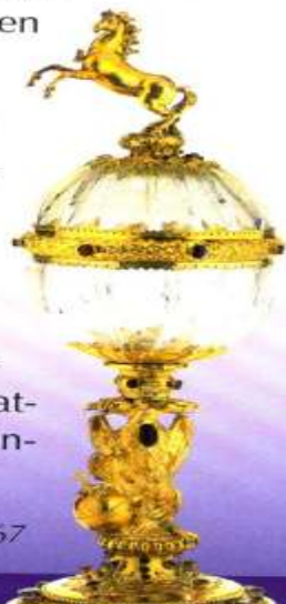
Pokal der westfälischen Landstände von 1667

NACH DEM AUSSCHIEDEN SOESTS entwickelte sich Arnsberg zur Residenzstadt. Hier saß die westfälische Regierung mit dem Landdrosten an der Spitze, hier tagten alljährlich die Landstände, die Vertreter der adeligen Rittergutsbesitzer und der Städte und Freiheiten. In den „Erblandesvereinigungen“ von 1437 und 1463 hatten sie sich dauerhaft ihren politischen Einfluss gesichert.