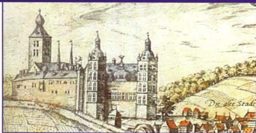
Ansicht des kurfürstlichen Schlosses in Arnberg, 1588

ERZBISCHOF GEBHARDT TRUCHSESS von Waldburg versuchte erfolglos, im Herzogtum die Reformation einzuführen. Im 30jährigen Krieg litten besonders die grenznahen Gebiete um Marsberg und Medebach. In dieser Zeit erlebte das Herzogtum eine Welle von Hexenverfolgungen. Während des Siebenjährigen Krieges (1756 – 1763) wurde das Herzogtum zum direkten Kriegsschauplatz und das kurfürstliche barocke Jagd- und Residenzschloss in Arnberg zerstört.