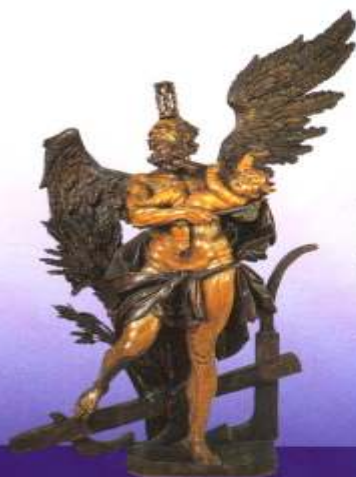
Chronos aus dem ehemaligen Augustiner- chorherren Kloster Ewig Attendorf, 1735